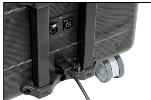
- Sync- und Netzwerk Anschluss