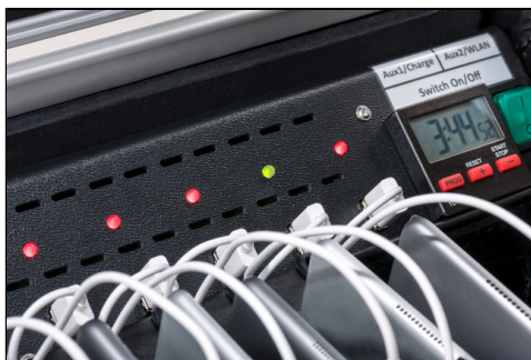
- LED Ladeanzeige